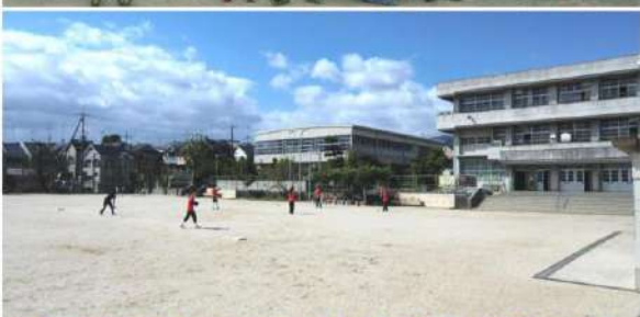
京都府長岡京市井ノ内玉ノ上 22 番地 長岡京市立長岡第十小学校